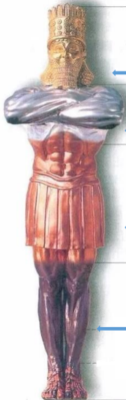
巴比伦 从公元前607年