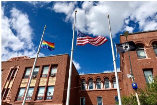
The Somerville City Council unanimously approved an ordinance that allowed groups of three or more adults to form domestic partnerships.

The city of Somerville has broadened the definition of domestic partnership to include relationships between three or more adults, expanding access to health care.